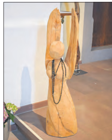
Die Materie Holz steht im Fokus: Gezeigt werden Lichtskulpturen, (Baum-)Fotografien und mit der Kettensäge gefertigte Holzarbeiten.